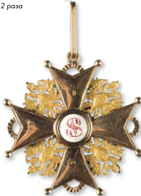
101 Знак ордена Святого Станислава 1-й степени Санкт-Петербург, мастерская Альберта Кейбеля. 1882–1899 гг. Размер 64 x 62 мм. Вес 29,8 г. Золото, эмаль

Клейма: на оборотной стороне на ушке – 56-й пробы с гербом Санкт-Петербурга; на верхнем луче – императорский орел, на нижнем луче – инициал мастера «АК».