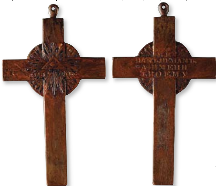
28 Наперсный крест «В память Отечественной войны 1812 г.» Санкт-Петербургский монетный двор 1814-1829 гг. Размер 79 x 45 мм. Вес 32,4 г. Бронза

Учрежден 30 августа 1814 г. для награждения всех священников Русской православной церкви от митрополитов до приходских священников включительно, состоявших в сани на 1 января 1813 г.