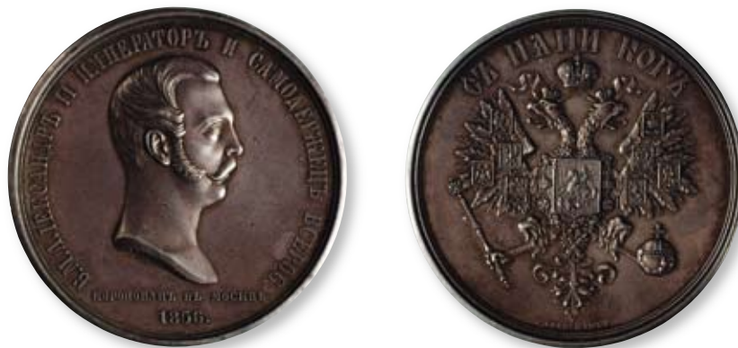
55 Медаль в память коронации императора Александра II Граверы: В. Алексеев, Р. Ганеман Санкт-Петербургский монетный двор. 1856 г. Диаметр 50 мм. Вес 74,8 г. Серебро